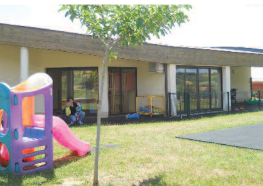
Crèche Petits Meuniers