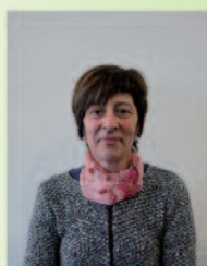
Evelyne FADDI Maire de Damiatte