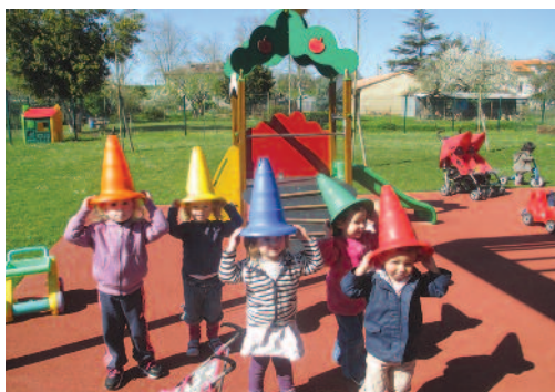
Crèche Il était une fois

En 2013, le RAM, ce n'est pas moins de 720 contacts téléphoniques, 160 entretiens individuels, 105 animations sur 5 pôles différents, 1 sortie exceptionnelle, 1 spectacle pour 100 enfants et des réunions thématiques, le tout accompagné par un Educateur de Jeunes Enfants.