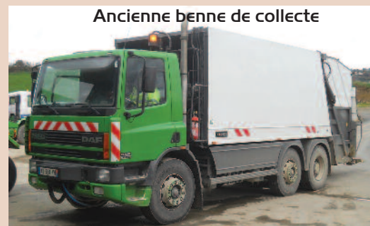
Ancienne benne de collecte

Afin de collecter les déchets tous les jours sur le territoire, la CCLPA dispose de 5 camions de collecte. En 2014, l'un d'entre eux sera renouvelé.