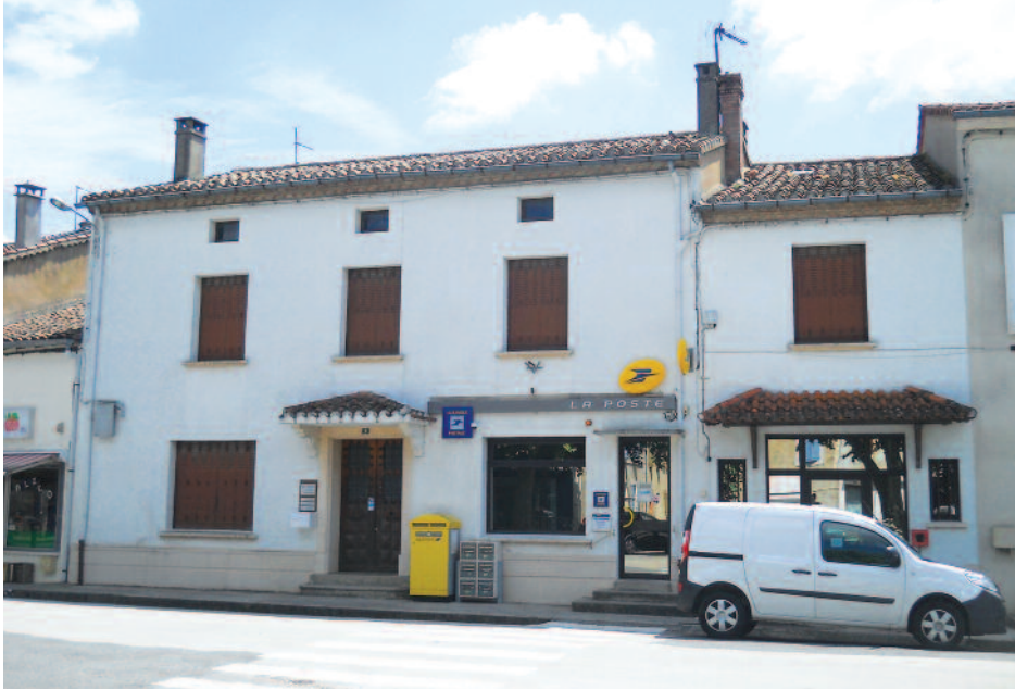
Projet de Pôle de Santé

Aujourd'hui, porté par la Communauté de Communes, qui s'est dotée en 2013 de cette compétence, le projet se veut fédérateur et moderne. Huit professions de santé seront associées à cette démarche (médecin, dentiste, kinésithérapeute, infirmières, orthophoniste, psychologue, ostéopathe, podologue).