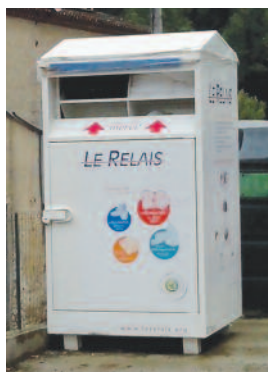
Bornes de recyclage