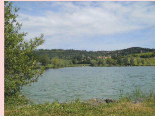
Grand Lac d'Aquaval

Il permettra de développer la végétation pour l'accueil et la reproduction des poissons.