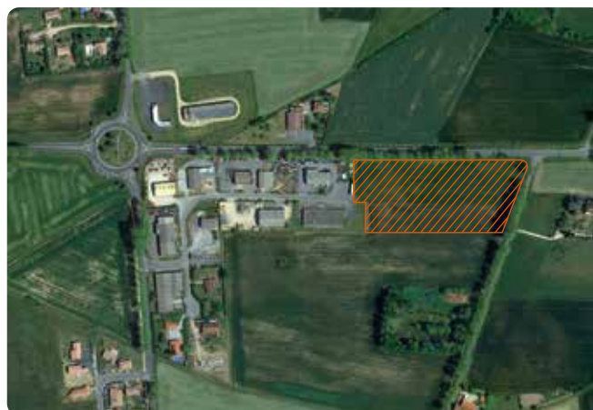
La zone d'extension prévue sur la ZAE Borio Novo à Vielmur-sur-Agout.

D'après nos estimations, suite aux différents échanges avec nos partenaires et après validation du Conseil, les travaux devraient débuter au début de l'année prochaine.