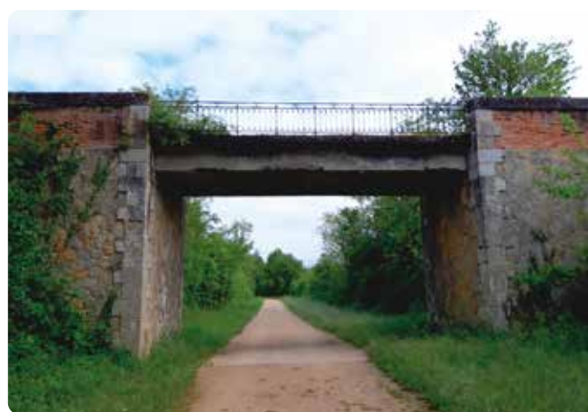
Le pont de Labadie surplombant la Voie Verte à Lautrec

Les travaux débuteront au 2 ème semestre 2021. Une déviation sera mise en place pendant la fermeture de l'accès au pont.