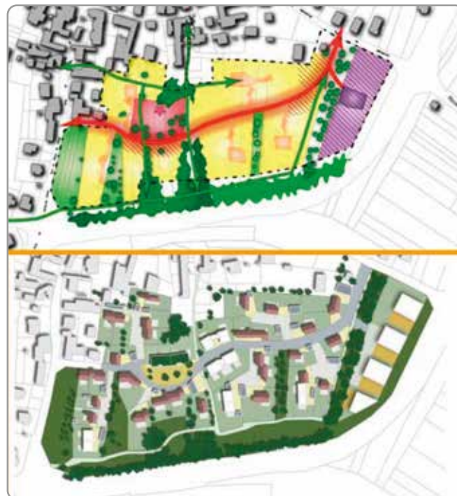
Exemple d'une OAP du PLUi sur la CC Val d'Amour (Jura) Rouge : Voirie / Vert : Végétalisation Jaune : Habitat individuel / Violet : Habitat collectif

Sur notre site internet : www.cclpa.fr , dans la rubrique PLUi, vous pourrez vous tenir informés de l'avancée du document. Il est encore temps de donner votre avis via les registres de consultation disponibles en mairie ou à la Maison du Pays à Serviès.