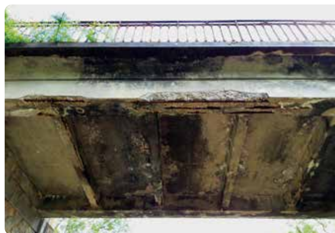
Le tablier affaibli par la pluie laisse éclater des morceaux de béton sur la Voie Verte, largement fréquentée par les piétons et cyclistes.