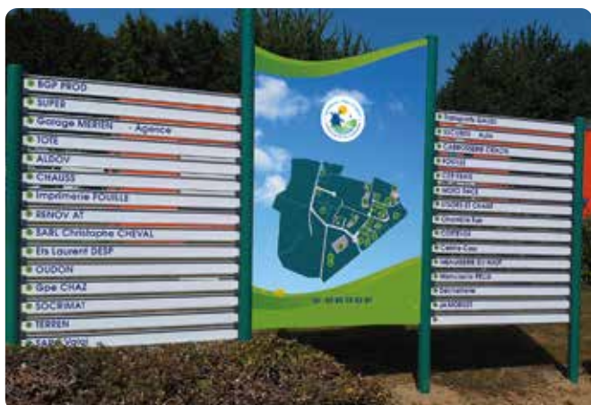
Exemple d'une signalétique adaptée pour les ZAE.

Convaincus de la nécessité d'avoir une signalétique claire et visible sur nos zones d'activité, les élus de la CCLPA ont validé un budget de 60 000 € pour réaliser ces structures qui mettront en avant nos zones et les professionnels présents.