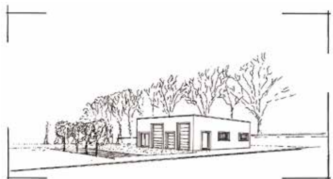
Esquisse du bâtiment imaginé sur la ZAE de Condoumines à Fréjeville.

Nous lui souhaitons la bienvenue et une bonne installation.