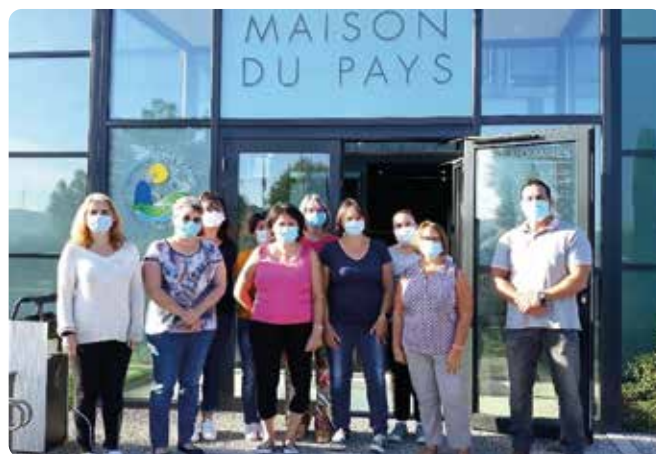
Les assistantes maternelles de la CCLPA bénéficient de formations régulières pour améliorer leurs compétences dans l'accueil des enfants.

Infos & inscriptions auprès du RAM de la CCLPA : 05 63 70 80 86 / ram@cclpa.fr